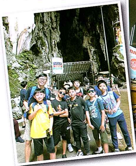
▼ 黑風洞內有鬼斧神工的藝術 Exploring the magnificent Batu Caves

舍友在馬來西亞到訪過不同的宗教名勝，包括黑風洞、國家清真寺、馬里安曼印度廟、仙四師爺廟、關帝廟、聖瑪麗大教堂等，都讓舍友大開眼界。舍友們還參觀了伊斯蘭藝術博物館，認識伊斯蘭文化。藝術方面，舍友遊覽吉隆坡城市畫廊、茨廠街及中央藝術坊；還有小學同學最喜歡的吉隆坡水族館和警隊博物館。是次考察活動實在太豐富了，各人差點樂而忘返呢。