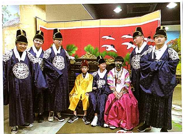
▲ 穿著韓服體驗文化傳統 Look like a Korean? Students wearing traditional costumes, Hanbok

八位學生代表經過多番努力及面試，終於順利參加二零一九年五月七至十日的韓國交流團，而今年交流團聚焦於科研及環保發展，最後更選出由同學們創作的“環保『OPPA』去旅行”作為是次旅程主題名稱。這次行程同學們分別去了南山首爾塔、水道博物館、KOGAS天然氣公社、廢棄物管理中心等等。過程中同學不單對環保科研的講解表現專心，更出乎意料地積極發問探究。有同學表示這次旅程帶給他一個寶貴的學習經驗，大大加強了自我管理的能力，並懂得調整個人的守時觀念而不影響團隊準時出發的安排。旅程中，雖然有隊員身體不適，然而同學們能互相照顧及幫助，充分發揮了團隊合作精神及智慧，為旅程賦予更大意義，帶給所有人會心微笑的回憶。