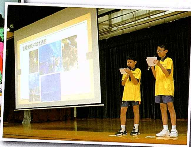
▼ 中心年終分享會上台分享所學 We share what we've learned from the trip