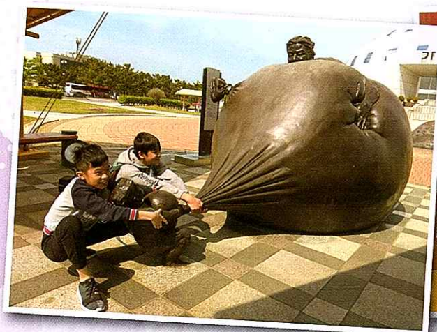
▲ 參觀韓國天然氣公社 Visiting the Korea Gas Corporation to get a more practical understanding of environmental protection strategies