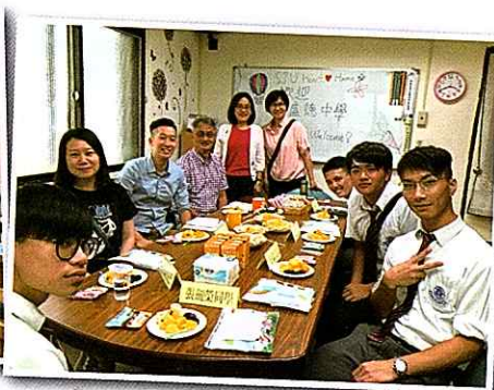
▶ 參觀聖約翰科技大學，並受到貴賓式的招待 Feel like a VIPs at St. John's University in Taiwan