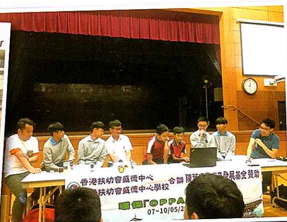
▲ 於早會與同學分享所見所聞 Sharing experiences and reflections in Korea with fellow schoolmates during morning assembly