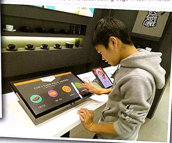
▼ 參觀三星d'light展館了解韓國現今的科技發展 Visiting the Samsung d'light museum to learn more the latest cutting-edge IT tech in Korea