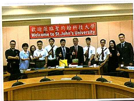
▲ 聖約翰科技大學與我校簽訂策略合作協議書 Attending the Contract Signing Ceremony between St. John's University and our school