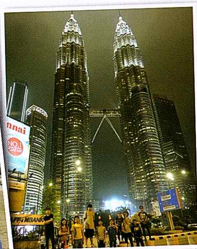
▲ 雙子塔好漂亮啊! The world's tallest Twin Towers- Petronas