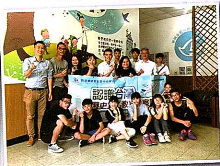
▼ 與當地的青年人互相交換聯絡方法，成為朋友 Keep in touch and become friends