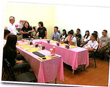
▶ 藍迪兒童之家負責人介紹他們的服務 Learning more about The Reindeer Social Welfare Children Home