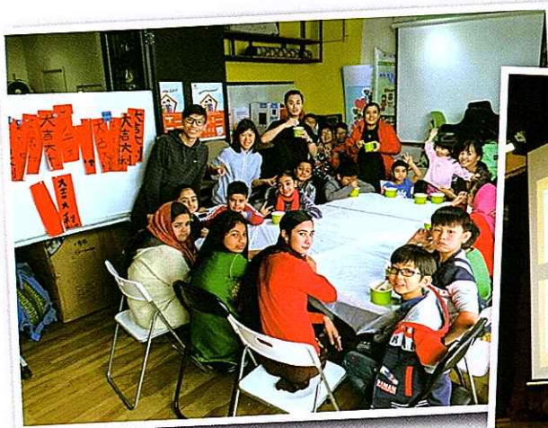
▲ 在港與不同民族朋友交流文化 We learn from difference nationality and cultural variety