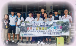
中四「澳門、珠海歷史文化考察團」 S.4 Macau, Zhuhai History & Cultural Trip