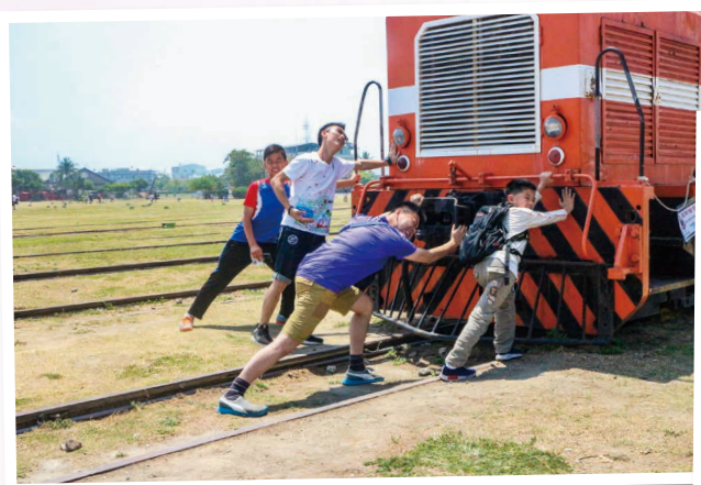
推動了嗎？加油！ Try hard, make it move!