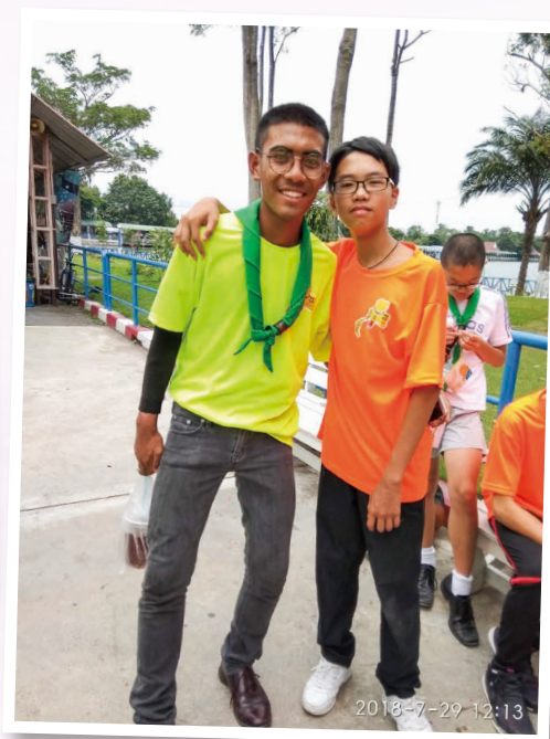
泰港童軍交誼 To strike up a friendship with Thai's Scout