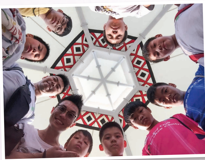
齊來大合照 Group photo at Christian Mountain Children's Home, Liugui Dist., Kaohsiung City, Taiwan