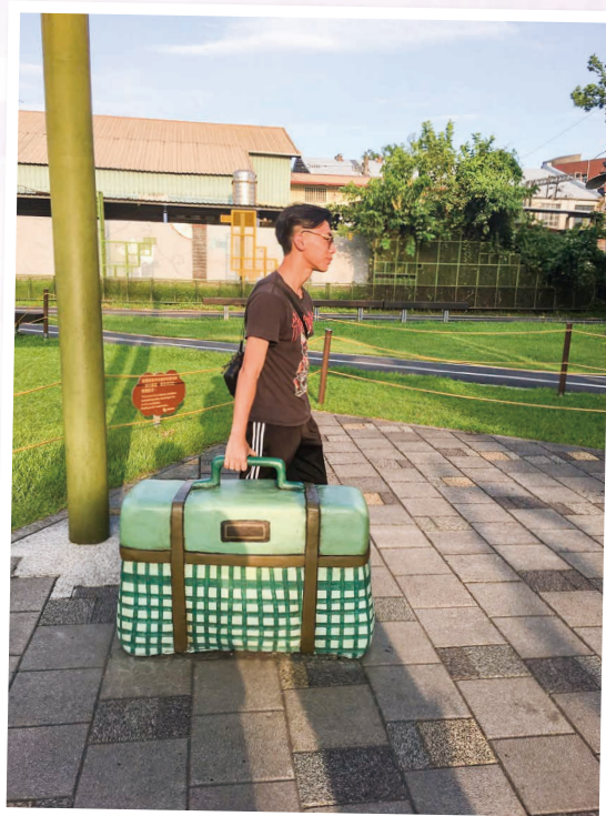
宜蘭幾米公園 Jimmy Park, Yilan