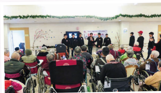
到達台北市私立道生院老人長期照顧中心探訪長者 Visiting The Taipei City Dao Sheng Assisted Living Facility

是次活動的籌備工作主要由學生負責，從網上搜尋當地長者院舍的資料、預訂機票和酒店，以及親自製作小禮物(襪小寶)送給長者。同學們在整個過程中都十分投入積極，長者們收到自製禮物都顯得喜形於色，深表欣賞，這令同學們深感欣慰及鼓舞，並體會到施比受更為有福的道理！