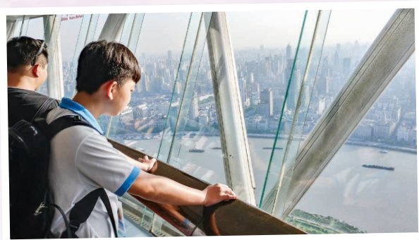
在東方明珠塔上欣賞美麗的上海 What a spectacular view on the Oriental Pearl Tower

這是我第一次去交流團，是一次很開心的旅行。我和同學於旅途中互相幫助，明白何謂團隊精神。我性格向來較內向，較少和其他人溝通，但在行程期間，我嘗試突破自己，主動和其他團友溝通。