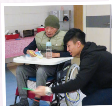
與長者同樂 Having fun with the elderly