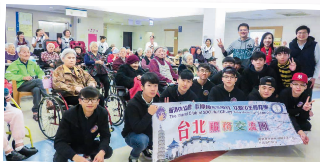
探訪大龍老人住宅的公公婆婆 Visiting Da-Long Elderly Residence