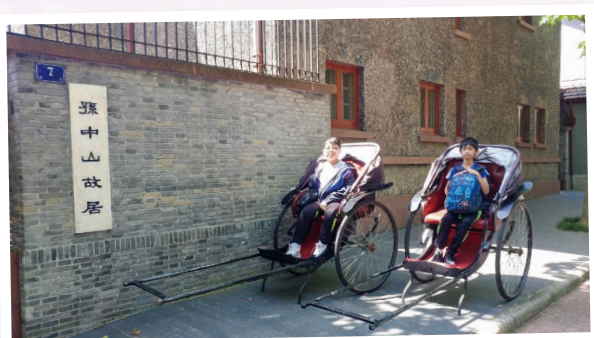
我的車伕呢？ Who is my rickshaw puller?