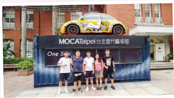
參觀台北當代藝術館 Visiting the Museum of Contemporary Art, Taipei

我第一次參加學校交流團，也是第一次坐飛機。飛機的離心力和空中服務員的良好服務態度，使這次交流團有一個難忘的開始。旅程中我發現台灣街頭有很多小食，而夜市更有很多我不認識的美食，例如：胡椒蝦。這裡還有很多不同的小店，有賣木工精品的，有賣明信片的，也有賣掛飾的，而且店員都非常友善。九份留着舊式建築，老街小巷都擠滿了人，有很多懷舊小吃可以選擇，可惜今次旅行不能把所有美食一一嚐透，幸好能吃到當地蔬菜—水蓮，額外感恩。另一可惜的是不能到礦洞或黃金博物館走一趟，不然更可以看見昔日淘金盛放的風貌。