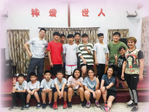
台灣原住民文化交流團 Taiwanese Aborigines Cultural Exchange Tour