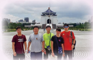
中五認識台灣歷史、文化、教育考察團 S.5 Taiwan Heritage, Culture & Education Study Tour