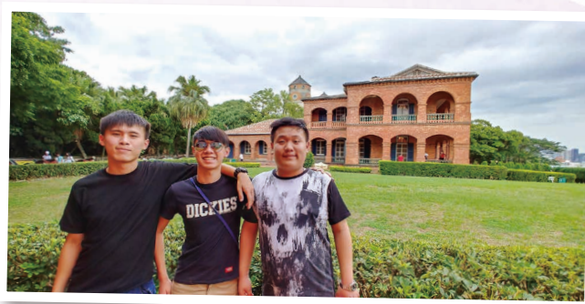
紅毛城原名「聖多明哥城」，是 17 世紀的建築 Built in 17th century, Fort San Domingo was nicknamed as "Fort Red Hair"