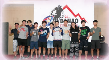
國際山地單車賽 International Mountain Bike