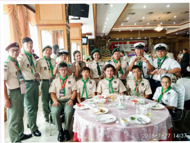
泰國童軍歡迎宴 Welcoming lunch by Pakkred Secondary School

則仁中心學校第 1685 旅童軍獲陳葉馮學術發展基金贊助，參加由香港童軍總會九龍地域深水埗東區區會主辦的泰國交流活動，十六位師生在二零一八年七月二十七日至三十一日期間與泰國學校多個旅團進行集體活動，該校設有全面的童軍訓練，童軍成員由學生組成，老師則擔任童軍領袖，其規模宏大得讓則校師生大開眼界。