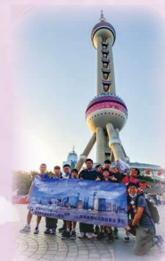
「我的成長滬旅」上海交流團 Shanghai History and Culture Exchange Tour