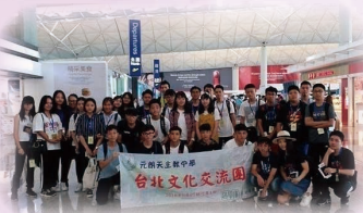
台灣文化交流團 Taiwan Cultural Exchange Tour