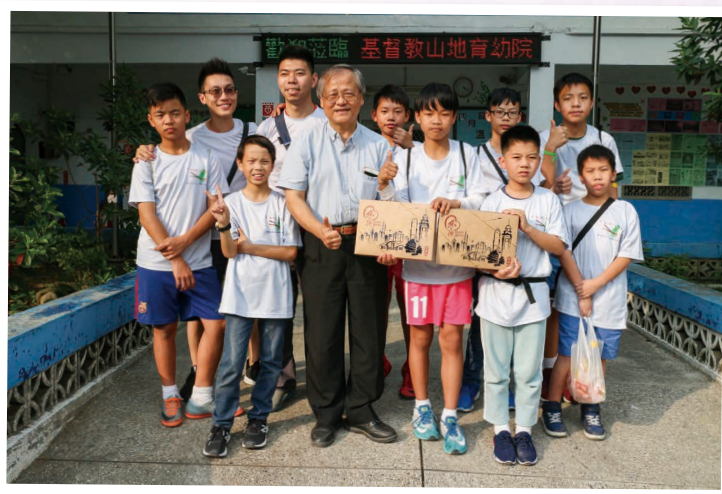
感謝山地育幼院的款待 Thank you for their generous hospitality