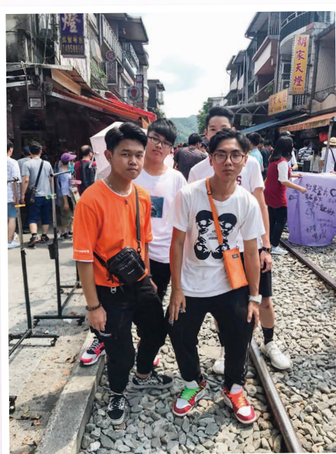
在十分一嘗放天燈的滋味 Fly a sky lantern in Shifen, Taiwan