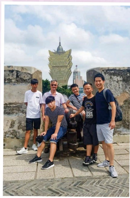
參觀澳門博物館及澳門的城市發展 Sightseeing of Macao Museum and city development