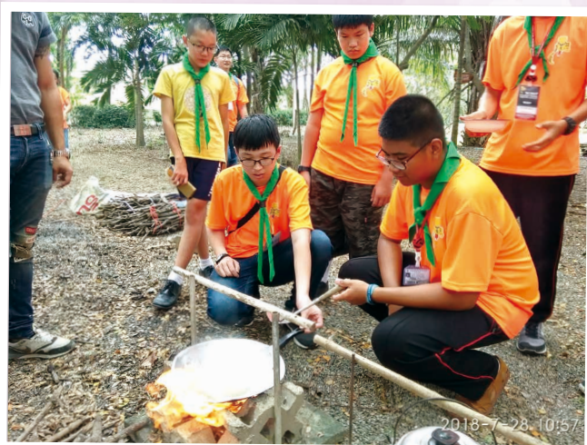
原野烹飪 Camp Cook training