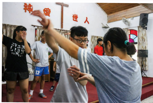
學習原住民舞蹈 Students are learning Aboriginal Dance