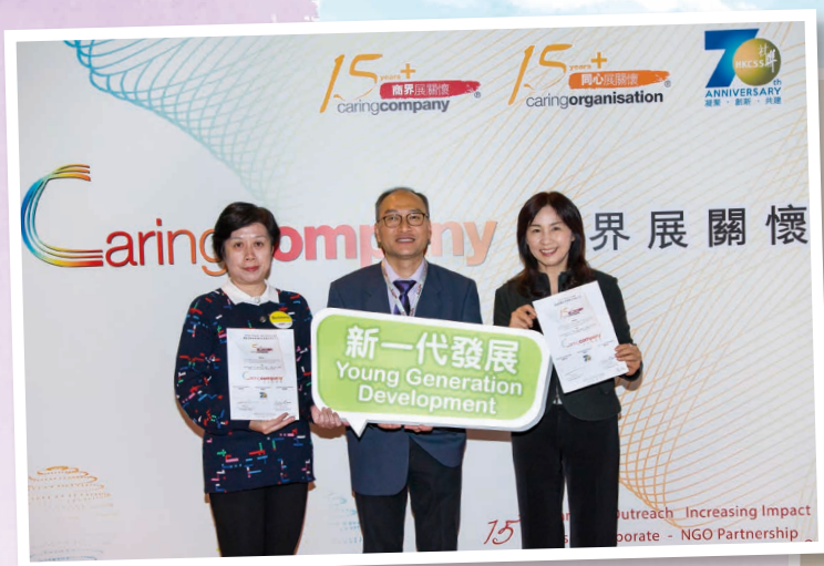
陳葉馮會計師事務所有限公司已連續 15 年獲頒「商界展關懷」標誌 15 consecutive years' 'Caring Company' Award for CCIF CPA Ltd.