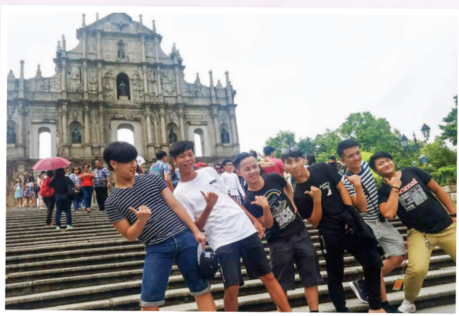
遊覽大三巴 Our tour in Macao started at Ruins of St. Paul's