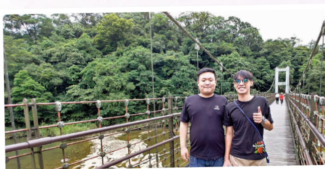
穿過靜安吊橋將會到達十分瀑布 Through the Jin-an Bridge will take us to Shifen Waterfall