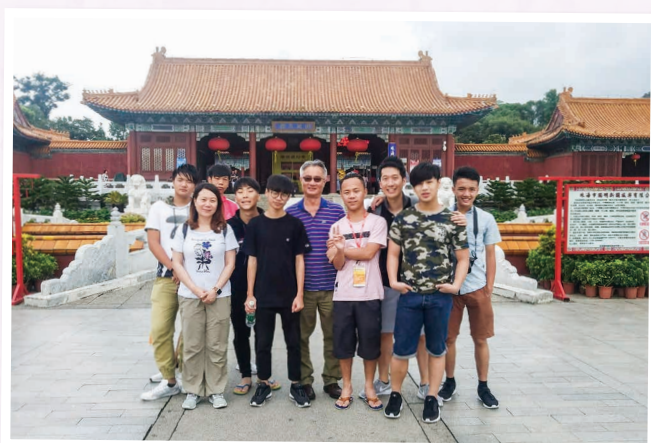
參觀圓明新園 Visiting New Yuan Ming Palace