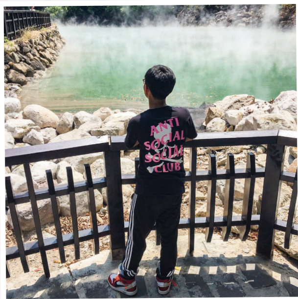
北投溫泉留影 Beitou Hotspring

中四鄧翹翀舍友獲陳葉馮學術及發展基金資助，參與就讀學校於二零一八年六月二十七日至七月一日的台灣文化交流團。除了到訪當地的慧燈中學及銘傳大學，亦參觀了林語堂先生的故居、故宮博物館及多個人氣景點，充份認識到台灣的教育及文化背景，並感受到台灣人的濃厚的人情味。