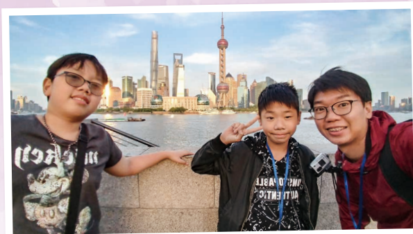
在上海外灘走走是指定動作 Famous lookout at Shanghai Bund