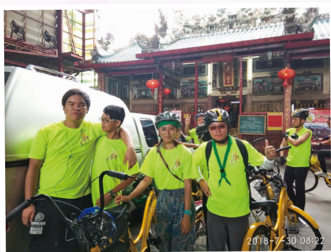
單車遊曼谷舊城 Cycling through Chinatown Bangkok