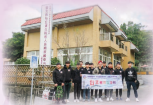
2017 台北服務交流團 Service Trip to Taipei 2017