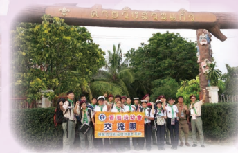
2018 泰國交流團 Thailand Exchange Tour 2018