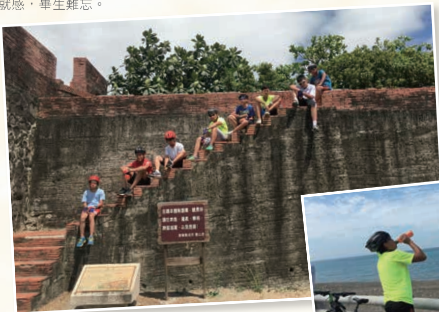
恆春古城東門 Hengchun Old Town East Gate

舍友由高雄出發，沿途經過枋寮和充滿陽光與美麗海灘的墾丁，再折返恆春古城。這次單車挑戰之旅，除了鍛鍊毅力，還訓練舍友團隊合作，互相照顧的精神；旅程充滿汗水和淚水，艱辛的體驗，心滿意足的成就感，畢生難忘。