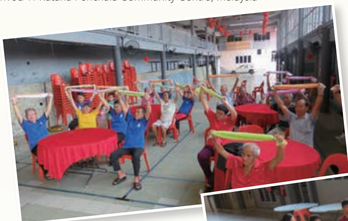
長者毛巾操 Towel Exercise with the elderly