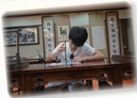
我係書法家 I am a calligrapher