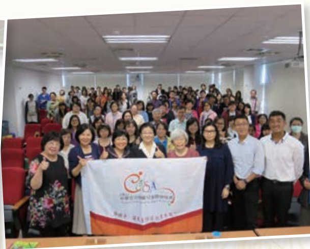
與台灣嘉賓一同合照 Photo with guests in Taiwan