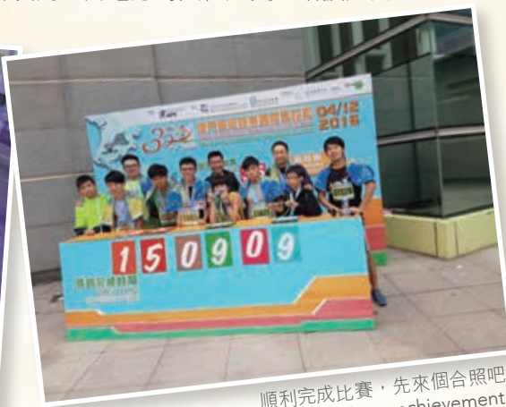
順利完成比賽，先來個合照吧！ Our record, our achievement!