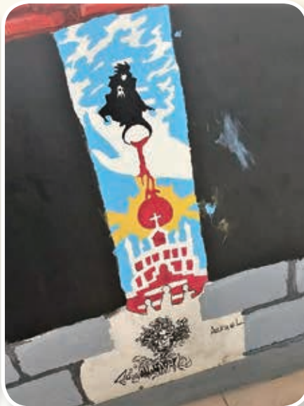
經學習後的成品之一 Art-drawing in a comic book