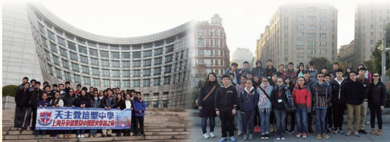
與學校參加者一同合照 Group photo with schoolmates

一位中四舍友獲陳葉馮學術及發展基金資助，參與就讀學校於二零一六年十二月六日至九日舉辦的遊學團。透過遊覽上海著名景點、博物館及當地大學等，了解當地歷史文化及為未來升學就業作出準備。