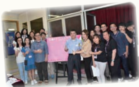
2017 禁毒時裝設計比賽 Anti-drug Fashion Design Competition 2017