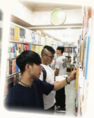
認識台灣歷史、文化、教育考察團 Taiwan History, Cultural & Education Study Tour