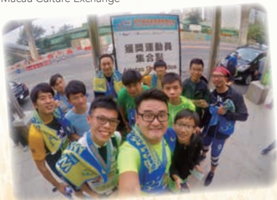
澳門迷你馬拉松 Macau Mini Marathon