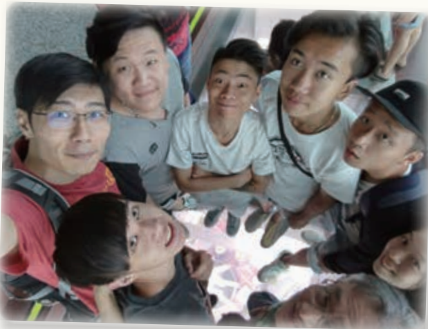
從澳門旅遊塔俯瞰路環與氹仔新舊城區的急速發展 Viewing the development of Macau from the old town to the rapid development of Coloane and Taipa at the top of Torre de Macau