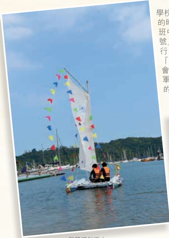
新雙體船下水 The new catamaran being launched

學校於二零一五年九月與「生命前線帆船事工」合作，以一年的時間建造一艘雙體帆船，寓意齊心協力為理想而努力。由一班中二年級的同學負責畫圖、開料、釘板、掃漆建造「則仁號」。大家有著同一目標，夢想坐著這艘自己建造的船出海航行。二零一六年十一月四日獲陳葉馮學術及發展基金資助完成「則仁號」下水禮，並邀請中國香港體育協會暨奧林匹克委員會香港運動員就業及教育計劃辦公室主管黃德森先生及香港童軍深水埗東區主席顏志偉先生主持新船下水禮儀式，為同學的理想起航。