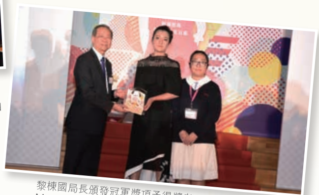
黎棟國局長頒發冠軍獎項予得獎者 Mr. Lai Tung-kwok, GBS, IDSM, JP, Secretary for Security presenting award to the Champion winner