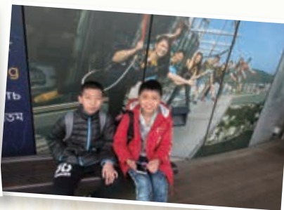
澳門旅遊塔上觀看澳門景色 Sightseeing on the Macau Tower