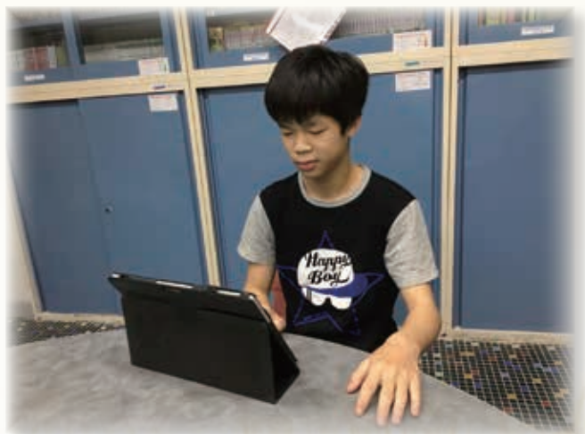
經維修電腦後，舍友可繼續使用電腦學習 'Regain' the computer for learning!

一位舍友正修讀為期兩年的職業訓練局資訊科技課程，新購電腦卻意外損壞，維修費用未能包括在保養條款之內，舍友於二零一六年十一月三十日獲陳葉馮學術及發展基金資助維修電腦，以能繼續學習。