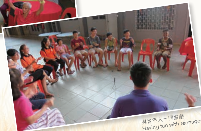
與青年人一同遊戲 Having fun with teenagers