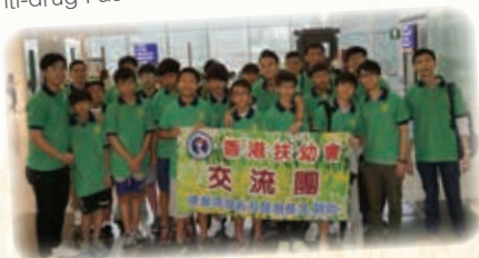
生命教育台灣交流團 Life Education - Taiwan Study Tour