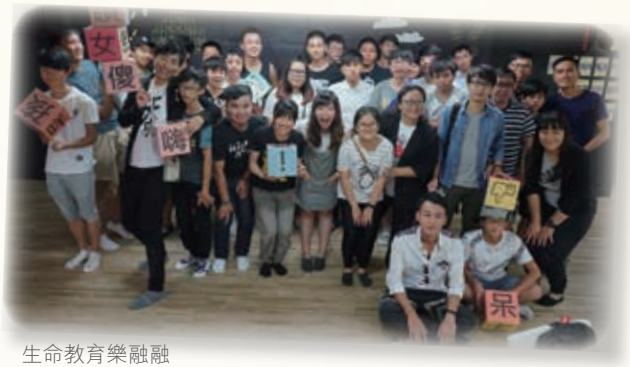
生命教育樂融融 Pleasurable moment in life education

生命教育與生涯規劃是香港現今不能避免的教育議題之一，台灣十多年前已由政府推動生命教育，成效顯著；本校於去年開始致力發展生命教育課程，一直希望與同學前往台灣親身體驗及取經。今年獲陳葉馮學術及發展基金資助十六名學生，於二零一七年六月十九至二十三日前往台南、台中、台北等地，到訪不同學校，包括市立松山高級中學、義守大學及實踐大學中學，了解台灣升學資訊及體驗台灣中學生命教育課程，獲益良多。