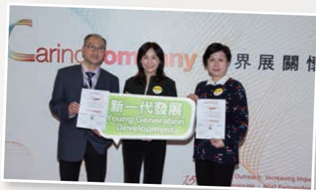
陳葉馮會計師事務所有限公司連續 15 年獲頒「商界展關懷」標誌 15 consecutive years' 'Caring Company' Award for CCIF CPA Ltd.