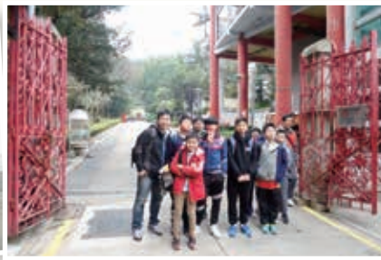
歷史悠久的二龍喉公園 The European-style Flora Garden