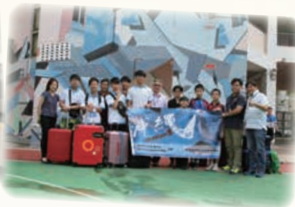
沖繩文化及海洋保育之旅 Okinawa Cultural and Marine Conservation Study Tour