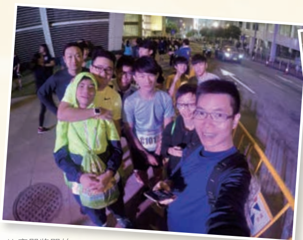
比賽即將開始 Getting to Marathon Start Line

六名舍友經過連串特訓後，獲陳葉馮學術及發展基金資助出席二零一六年十二月三日至四日於澳門舉行的迷你馬拉松比賽。其中四位參賽者當天都能在指定時間內完成比賽，體會到全力以赴的精神。除了體能鍛鍊外，舍友們更懂得搜集賽場資料，做足預備功夫以應付香港以外的比賽，活動肯定他們訓練多時的成果。他們在比賽後亦於澳門參觀不同文化景點，藉以了解澳門不同地方的文化歷史，增擴見聞。