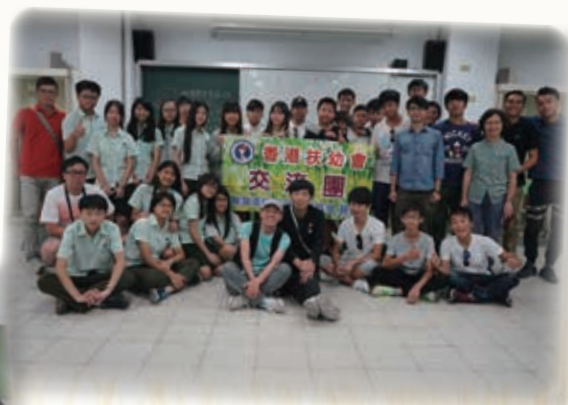
拜訪臺北市立松山高級中學 Visited Taipei Municipal Songshan Senior High School