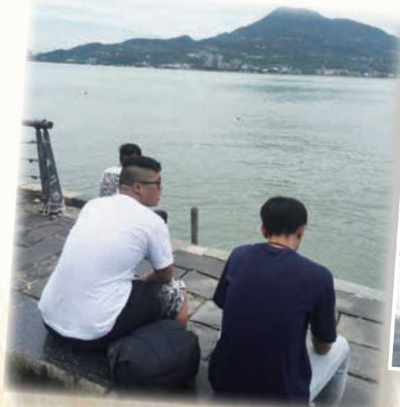
在淡水漁人碼頭小休一會 Take a break at Tamsui Fisherman's Wharf