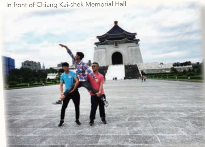
中正紀念堂留影 In front of Chiang Kai-shek Memorial Hall