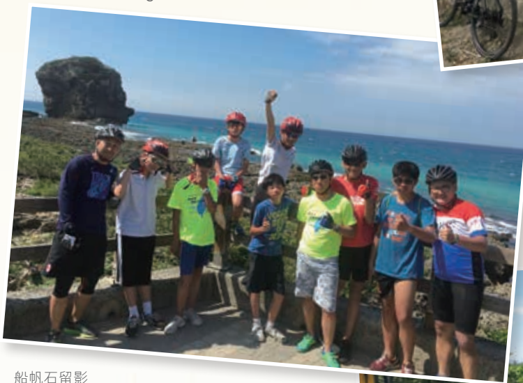
船帆石留影 Yeah! We finally arrived at Chuanfan Rock!