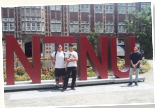
參觀國立臺灣師範大學感受校園氣氛 Visiting National Taiwan Normal University to feel the school life there

“我們除了參觀一些台灣舊式的建築物外，還遊覽了台灣紀念園區。中正紀念堂是為蔣介石先生而建的，古色古香的建築，可容納數千人的大廣場，令我大開眼界。從蔣介石先生的雕像和其他展覽簡述中，我可以了解到蔣先生的生平事蹟及中國近代的歷史事件，令我獲益良多。”