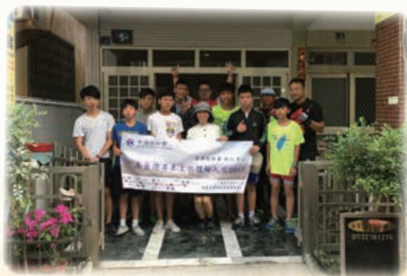
南台灣單車文化體驗之旅 South Taiwan Cycling Cultural Trip