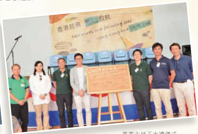
嘉賓主持下水禮儀式 Our guests of honour