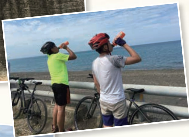
途經屏鵝公路 Taking a break at Ping-E Highway