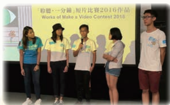
聆聽·一分鐘 短片製作比賽 Make A Video Contest