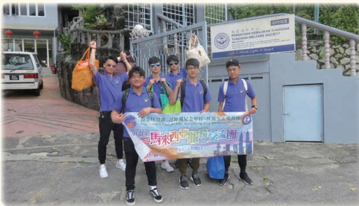
到達慈愛福利中心 Arrived Ti-Ratana Penchala Community Centre, Malaysia

是次旅程主要的目的是透過探訪當地慈善福利組織慈愛福利中心，認識馬來西亞的長者及孤兒服務。同學分別與住在該處之老人及青少年進行活動並為他們送上香港特色的小食及禮物。公公婆婆及青年人熱烈的反應增加了團員們帶領活動的信心，讓他們更享受服務的樂趣及領略施比受更有福的道理。