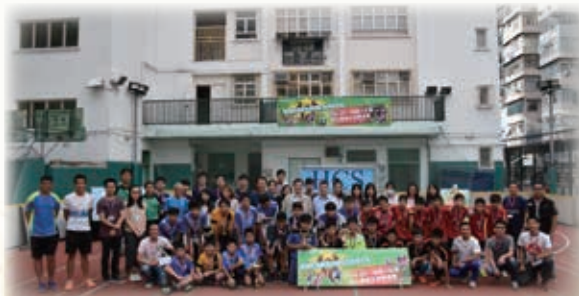
參加者大合照 Group photo with participants

圍板足球場較標準足球場細，故攻守節奏相對地快，更考驗球員的控球技術、速度及反應，而且著重團隊精神及隊員間之默契。來自不同學校的足球精英在球場上施展渾身解數爭奪殊榮，球員們在場面緊張的比賽中亦展現了崇高的體育精神——尊重。本校學生透過這兩天的服務及觀摩球賽亦肯定了自己的價值及擴闊了眼界。