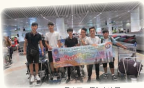
2017 馬來西亞服務交流團 Service Trip to Malaysia 2017