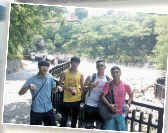
北投溫泉景區遊覽學習當地環境保育 Observing ways of environmental conservation at Peitou Hot Spring District