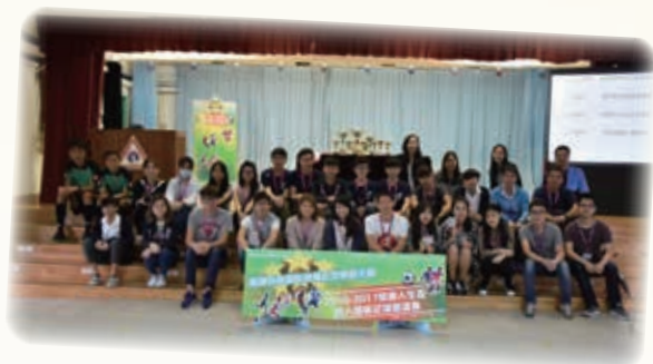
2016-2017 健康人生盃第三屆四人圍板足球邀請賽 Healthy Life Cup 2016-2017 · Futsal Football Competition