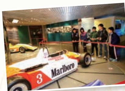
小車迷逛大賽車博物館 Visiting the Grand Prix Museum