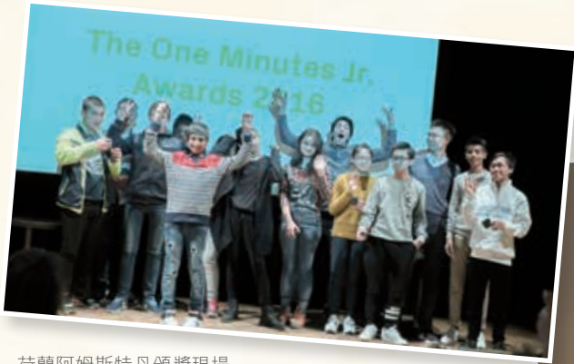
荷蘭阿姆斯特丹頒獎現場 "The One Minutes Junior Awards 2016" at Amsterdam

一位中五學生於二零一六年六月參加了聯合國兒童基金會舉辦的一分鐘短片製作，作品《慣裳》入圍了高中組獎項。學生獲陳葉馮學術及發展基金資助零用，出席同年十一月二十三日至二十九日於荷蘭阿姆斯特丹的頒獎典禮。同學是五位香港代表之一，足以肯定同學努力之成果。