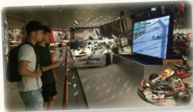
參觀澳門大賽車博物館，了解澳門賽車歷史 Visiting the Grand Prix Museum on the history of racing in Macau

“我覺得澳門與香港分別不是太大，最不同的地方是使用簡體字的地方比較多，城市建築也像中國大陸。最難忘是在觀光塔上看見其他人玩笨豬跳，單是觀看都感受到「跳下去」的衝擊。再者，可以與校長、班主任和同學一起到澳門，實是一次難得的經歷。”