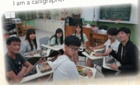
秀“識”可餐 Great meal with local students