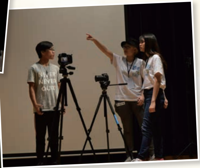
一分鐘短片製作 Making one minute video