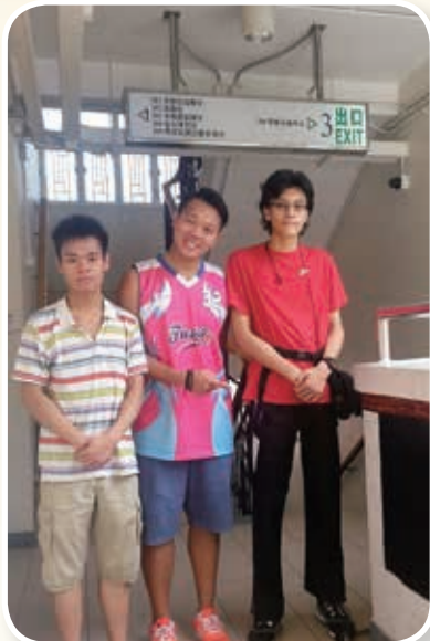
(左起) 舍友、宿舍導師侯 Sir 及 Art@L 畫家準備藝術創作 Let's learn about Art

一位中六舍友獲陳葉馮學術及發展基金資助，參加由本會 Art@L 於二零一六年十二月二十四至三十一日期間為期四堂的插畫製作班，舍友於過程中了解插畫師的工作及藝術發展，並學習如何創作故事、人物及背景構圖等技術，為未來從事藝術工作做好準備。