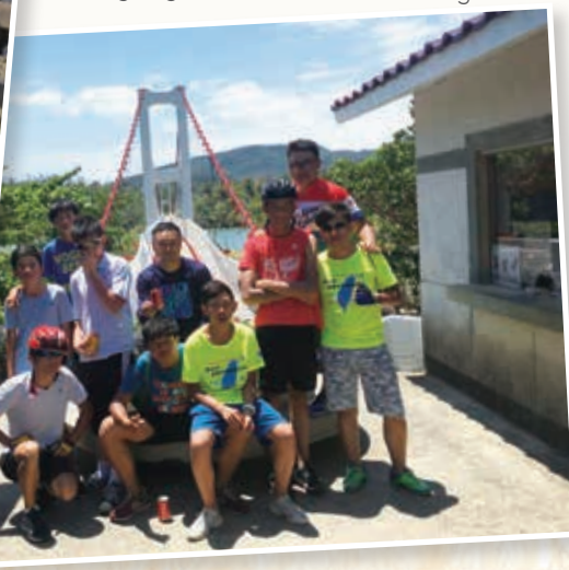
屏東滿州情人橋 Pingtung Manchurian Port Drawbridge