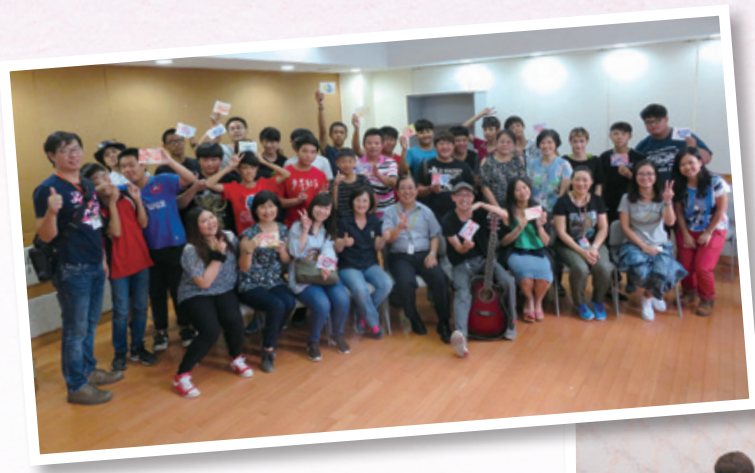
自信地展示由 Art@L 教授的明信片 Showing their handmade post card