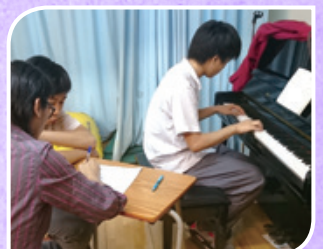
英國皇家音樂學院聯合委員會 - 鋼琴級別考試