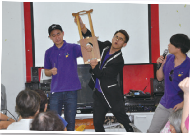
緊張的魔術表演令公公婆婆們熱血沸騰 Magic show by us really stunts