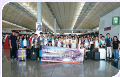
台中文化及生態保育考察團 2016