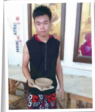
體驗台灣的陶藝 Experiencing Taiwan pottery art