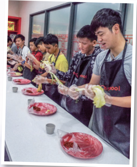
齊齊做泡菜 Kimchi makers

韓劇橫掃亞洲，甚至歐美人士也齊來煲劇。同學來到 KBS 電視台，就明白韓劇穩坐亞洲首席的原因，製作認真，一場一景都真實無異，令人讚嘆。三星先進的科技，南山韓國村的傳統，竟可在首爾和平共存，確值得港人深思。景福宮呈現朝鮮的歷史，以及戰爭紀念館的戰事紀錄，令同學認識到今天韓國的成就，原來是一次又一次的苦難中歷練出來。同學非常感謝陳葉馮會計師事務所有限公司設立基金，讓他們能經歷了這次有意義和令人難忘的旅程。