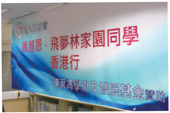
陳葉馮學術及發展基金全資贊助是項活動 Visit sponsored by CCIF Fund

飛夢林家園獲陳葉馮學術及發展基金資助一行二十七人於二零一六年七月十八至二十一日來港交流，讓台灣青年有機會來到香港認識本會院舍及體驗香港特色文化。