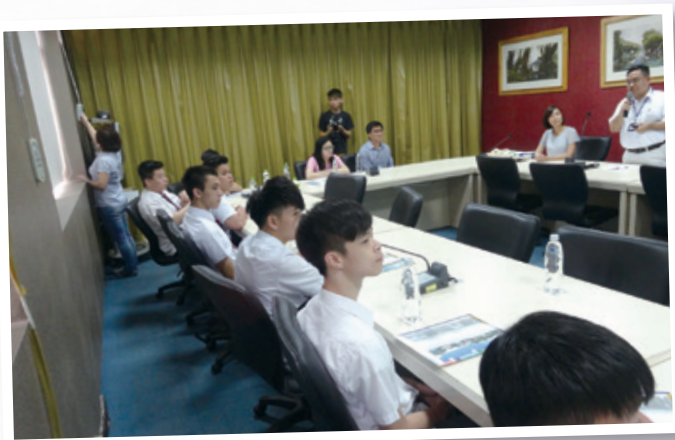
出席台灣師範大學 (僑生先修部) 入學簡介會 Learning about admission to National Taiwan Normal University, Division of Preparatory Program for Overseas Chinese Students