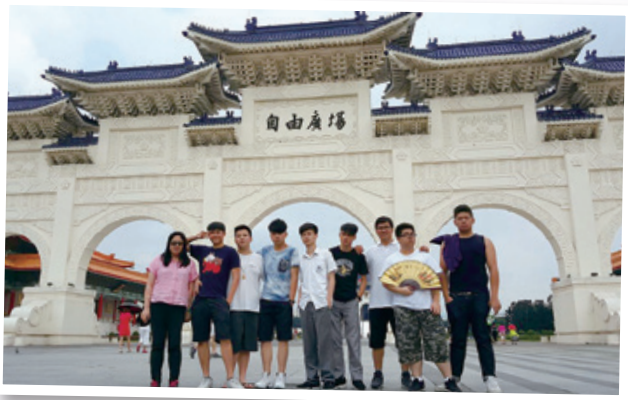
台灣自由廣場留影 Group photo taken at Liberty Square, Taipei

當同學實地視察焚化廠的運作後，非常欣賞台灣人對環保的重視，相反，香港環保工作實在追不上，並讓同學反思日常生活的浪費。