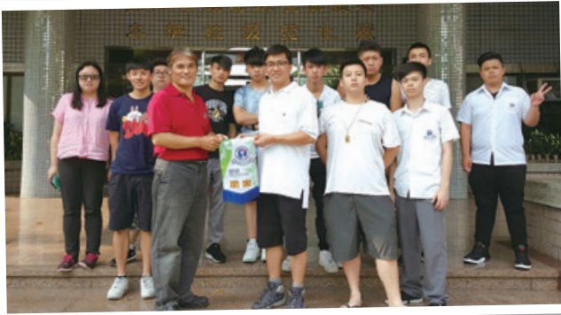
在木柵垃圾焚化廠門前向廠長致謝 Presenting souvenir to the Chairman of Muzha Refuse Incineration Plant