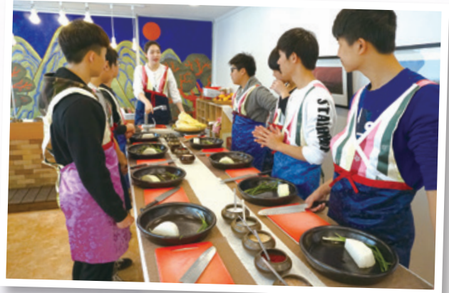
留心聽講製作泡菜的程序 Making authentic Korean Kimchi

獲陳葉馮學術及發展基金資助於二零一六年三月十五至二十日，由宿舍社工及導師帶領六位舍童拿起背包遊南韓。行程包括參觀景福宮、光化門及北村韓屋，遊覽當地名勝以了解南韓新舊文化差異，體驗當地人民的生活習慣，讓舍童擴寬生活視野。整個行程由參加的舍童分組搜集資料後商討決定。而於行程完結後安排分享會，讓他們向其他舍友分享是次學習體驗。