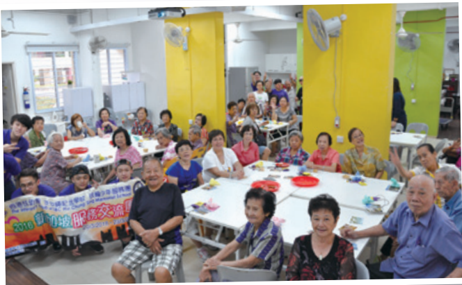
開開心心玩完一個下午，和公公婆婆來張大合照！ Smiling faces after services