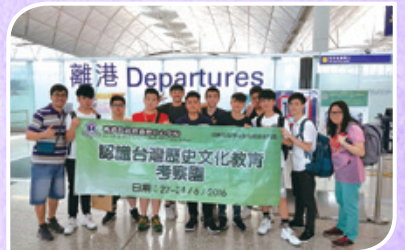
認識台灣歷史、文化、教育考察團