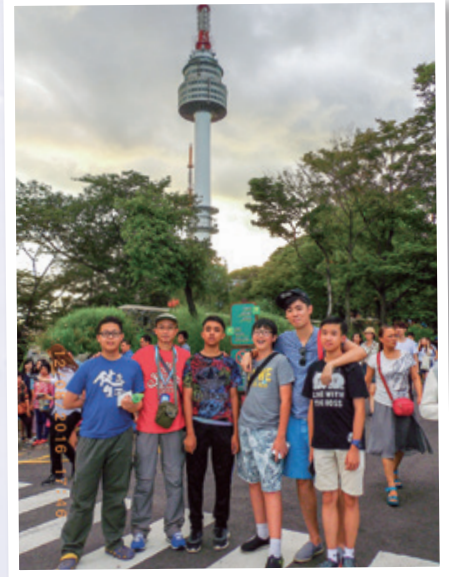
首爾版鐵塔凌雲 Seoul version of Eiffel Tower over the clouds