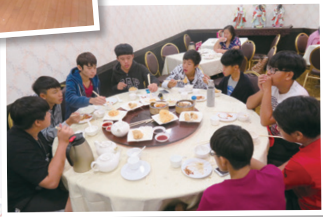
一嚐香港的飲茶文化 'Yumcha' in Hong Kong