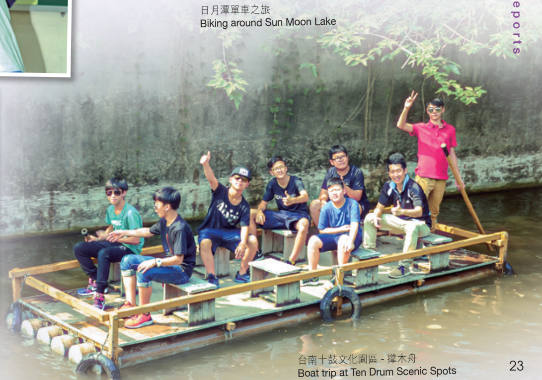
台南十鼓文化園區 - 撐木舟 Boat trip at Ten Drum Scenic Spots