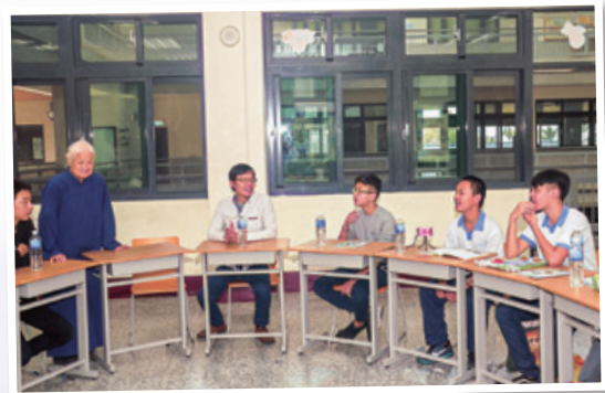
在陳網少年家園的真情分享 Visiting Liang-Shien-Tang Social Welfare Foundation