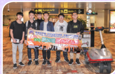
2016 新加坡服務交流團