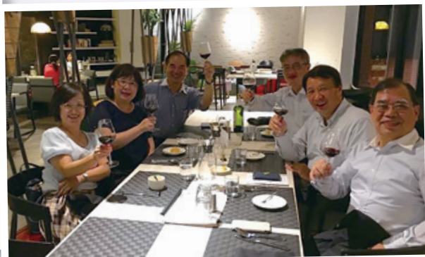
感謝善慧恩熱情招待 Thank you for the GWG hospitality