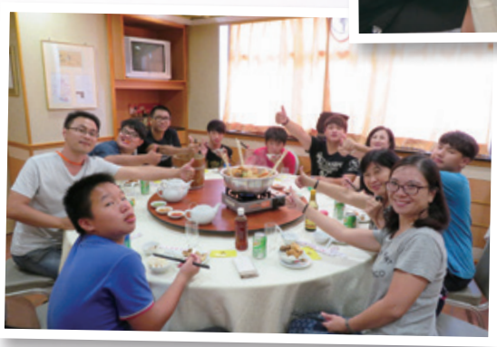
品嚐傳統盆菜 Lets try traditional 'Poon Choi'