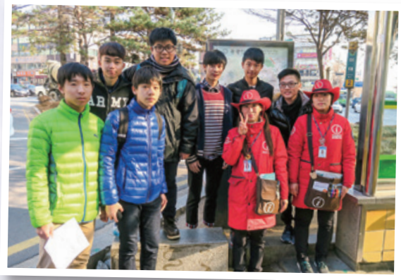
了解韓國義務工作者的工作 Meeting local volunteers