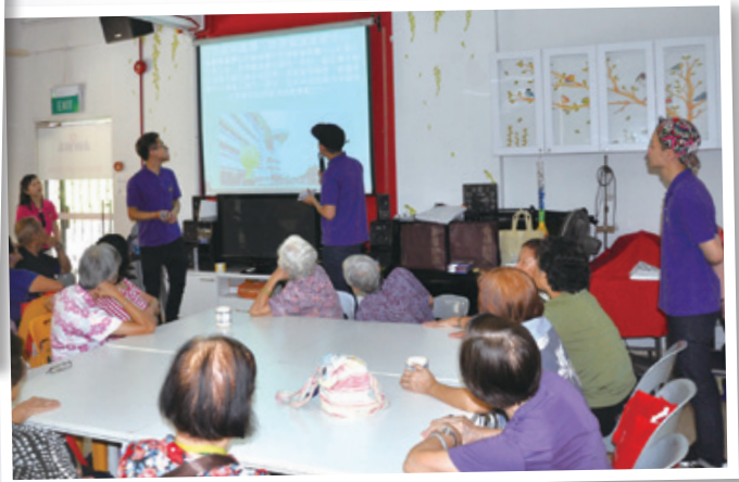
公公婆婆們對香港很有興趣... The elders were interested to learn about Hong Kong