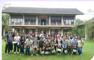
新加坡英語學習計劃