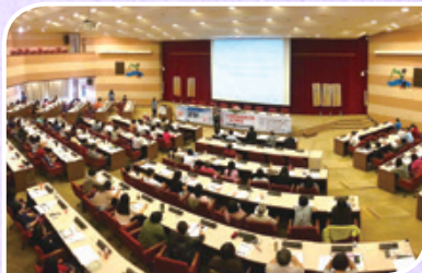
2016 深耕與翻轉未來~從預防到復原之路 - 培力陪伴 實務 / 國際研討會