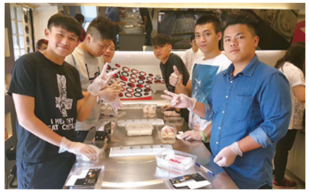
親身製作台灣土產鳳梨酥 Making pineapple cake

同學參觀食品廠，了解台灣營商環境、產品質素研究及如何受到日本文化影響。同學還嘗試製作鳳梨酥，體驗食品製作過程。當然，熱烘烘的出爐食品更讓他們興奮不已。