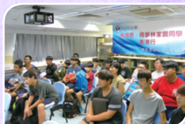
飛夢林青年香港行