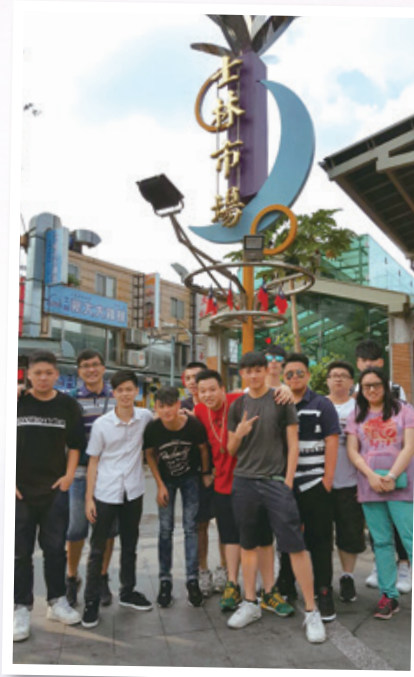
士林市場留影 Group photo taken at Shilin Market

學生對小吃「棺材板」最感特別，名字有趣吸引，卻原來是肉鬆麵包，更欣賞當地人生活的幽默。攤檔店主落力招呼，與香港食肆截然不同，那種熱情的待客之道，更讓學生體味台灣人情。西門町物價較香港便宜，令學生們購物慾大增。購物的過程讓學生比較兩地的消費指數，令其深思畢業後的生活，同學指出如能在香港工作，台灣生活就很理想了。