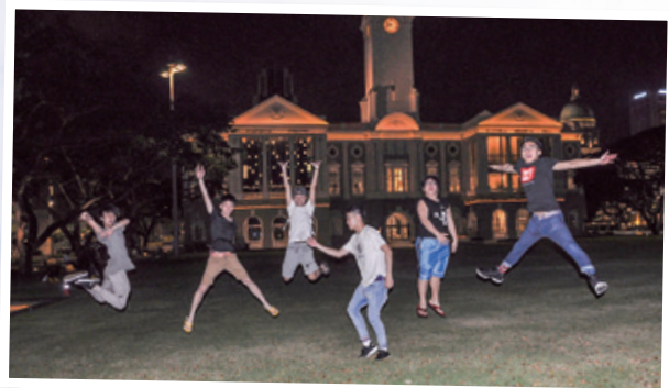
今次這個新加坡服務交流團真係開心到飛起...! Happy to fly!