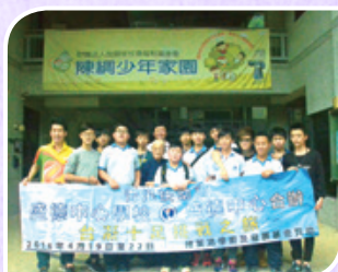
台癡十足挑戰之旅