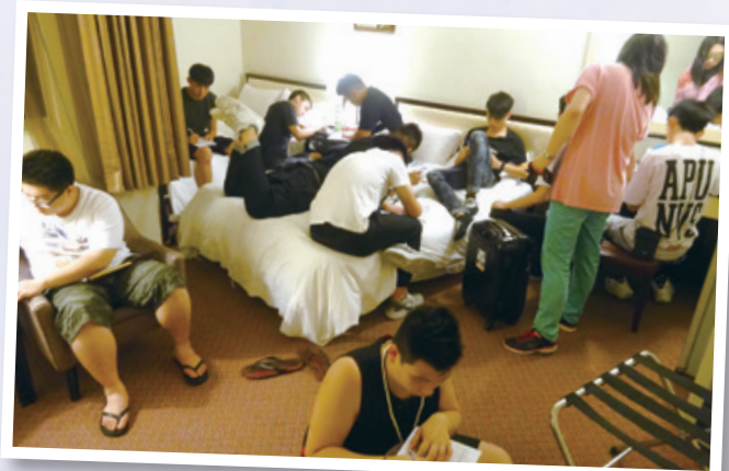
分享晚會，學生筆錄當天遊趣 Taking down every interesting moment in night sharing

學院主任、導師及各職員熱情招待，還邀請香港僑生分享經驗，讓同學們了解當地升學條件及生活需要。台灣四周充滿自然氣息，環境優美，滿佈文化色彩，是升學的好選擇。