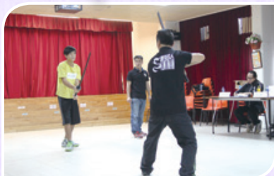
動作特技演員專業訓練課程

CCIF Scholarship & Development Fund Reports