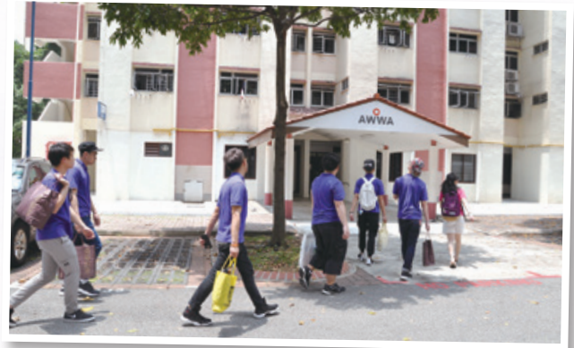
我們浩浩蕩蕩地到達 AWWA 老人活動中心 Going to the AWWA Elderly Centre