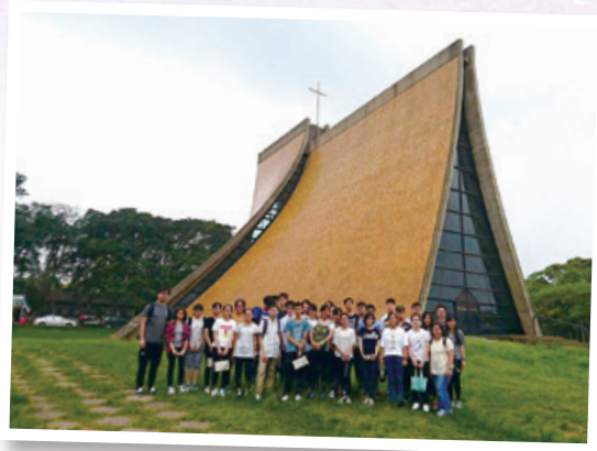
參觀東海大學 Visit to Tunghai University

一位中六舍友成功獲陳葉馮學術及發展基金資助，參與就讀學校於二零一六年五月三至七日的考察團。透過參觀高美濕地、合歡山、東海大學、車埕老街、逢甲夜市等，了解當地的生活文化及學習對自然生態保育的方式。