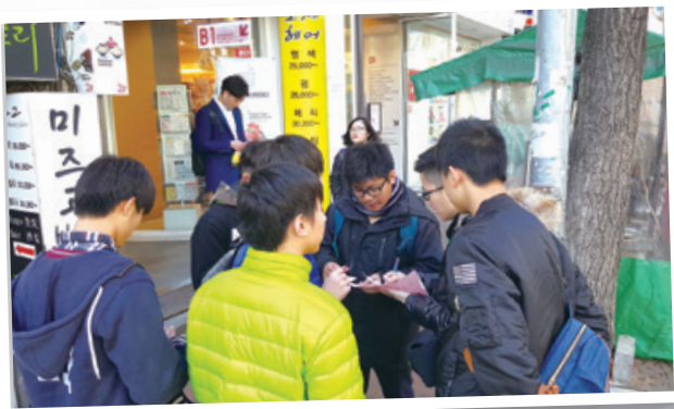
接受由導師精心設計的小任務 Assignments before starting the trip