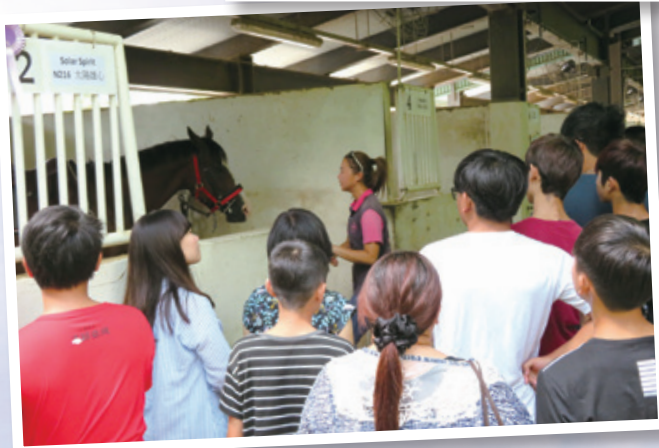
參觀騎術會馬房及聽取有關馬匹的介紹 Visiting saddle club