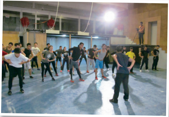
由專業導演訓練及指導 Professional stunt training