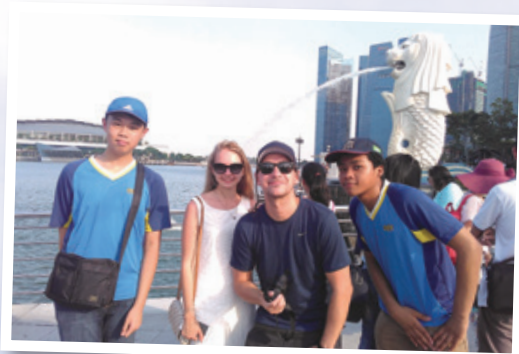
學好英語，與外籍人士交流 Making foreign friends in Singaporey

一位中四舍友成功獲陳葉馮學術及發展基金資助，參與就讀學校於二零一六年六月三十日至七月四日的遊學團。透過遊覽新加坡著名景點、參觀當地規劃局和交通管理局、永續展覽館、博物館以致濕地自然保育區等，增加學生對新加坡的歷史、文化及城市發展有所瞭解和認識，並同時提供不同語境促進同學接觸和使用英語的機會。