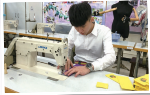
出發前同學細心地自製交通咭套送給新加坡的公公婆婆 Sewing ticket pocket for Singaporean elders before the trip

這次服務交流團主要的目的是認識新加坡的老人服務，事前聯繫了當地一個為弱勢社群服務的機構 AWWA 的老人活動中心，這個老人活動中心位於新加坡的其中一個老人社區，他們大多是獨居長者，我們與他們歡渡了一個下午。新加坡是一個多元民族的國家，但因華人佔大部分比例，故此團員們在籌備活動時主要以普通話演練，但服務當天有不少的公公婆婆竟能聽懂廣東話，這使團員和公公婆婆們更能打成一片，公公婆婆們熱烈的反應增添不少團員們帶領活動的信心，亦讓他們更享受參與服務的樂趣及明白施比受更為有福的道理。