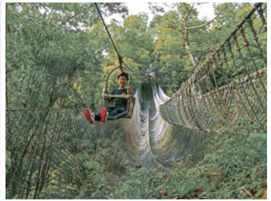
挑戰大坑農莊的吊橋繩網陣 Jungle fly at Dakeng leisure Farm