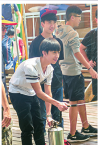
台南防災教育館 - 救火體驗 Fighting a fire at Disaster Prevention Education Centre