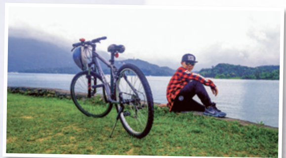
日月潭單車之旅 Biking around Sun Moon Lake