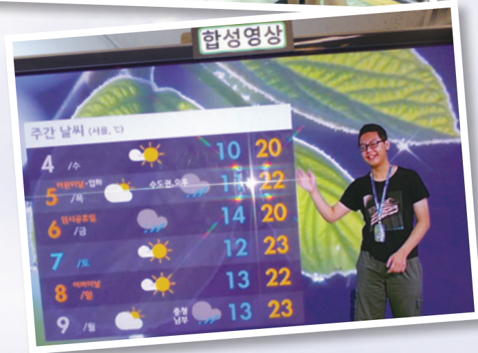
參觀 KBS 電視台 Visting KBS World Radio